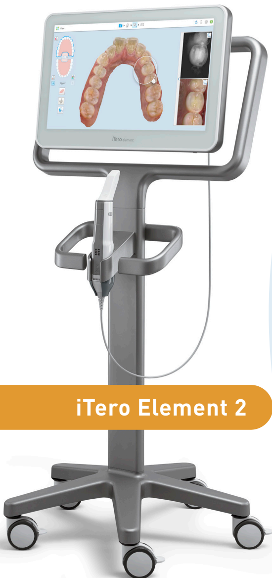
iTero Element 2